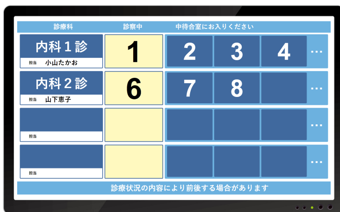
診療科ごとの診療状況を 1 画面にまとめて表示