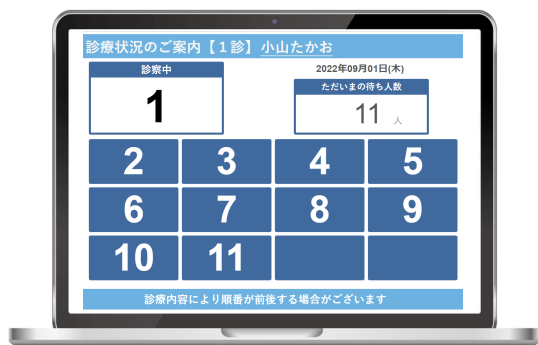
呼出端末（診察室内）