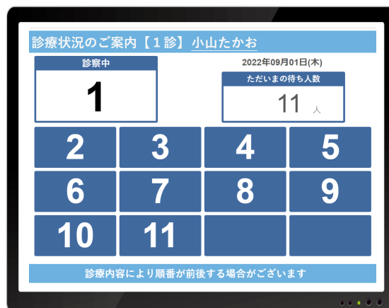
外部接続ディスプレイ（診察室外）